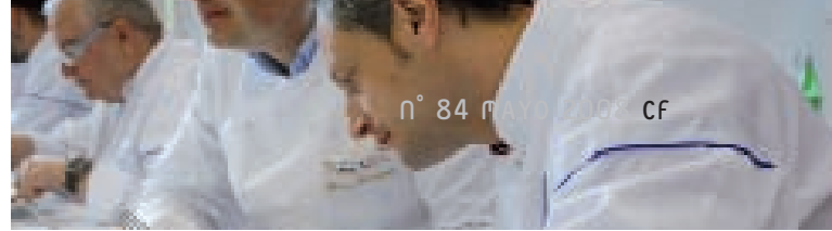
➔ Primer plano del jurado

En el pabellón de Cristal se encontraba el stand de Luis de Blas. Allí pudimos degustar una línea de conservas artesanales, más concretamente jaleas de vinos, varietales chilenos, de forma sólida, sin alcohol, producidas por la empresa Chilean Wine Jelly, bajo la marca Alma-Sol. De elaboración artesanal, estas conservas dulces se emplean cada vez más en la cocina como acompañamientos de pinchos, tapas o refuerzo de salsas, y tienen magníficas cualidades nutritivas, sin grasas, sin alcohol, con elementos naturales de la fruta, y siempre 100% naturales.