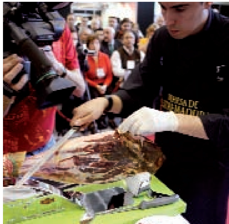
➔ Prueba eliminatoria del concurso de cortadores